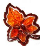
Cenicero hoja de Artec