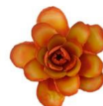
Rosa naranja de Pauloliveiraartesanato