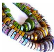
Collar de papel de Js Design Sustentavel

Para elaborar esta mesa de juego de ajedrez y damas , utilizó distintas maderas: nogal, cerezo, teca, aliso y pino ruso, forman la cuadratura maciza a la que, a los ojos de un experto, será difícil resistir.