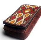
Portacelular de Quiron Cuero