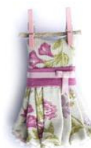
Broche vestido tendido de Jarrillo De Lata