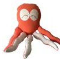
Muñeco Pulpo de Chicamama