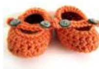
Patucos de Tramontana