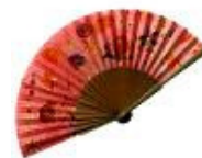
Abanico de Pinturasobreseda