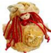
Broche de Las Muñecas De Mama