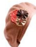
Boina de lana de La Muka