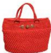
Bolso de Maravillas de Ganchillo