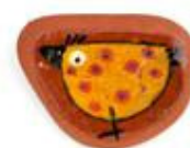
Broche de Corda Bamba