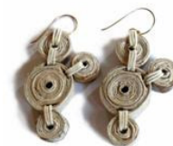
Pendientes de papel de Js Design Sustentavel