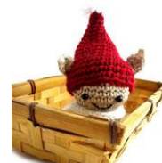
Duendecillos amigurumi de Airali Handmade