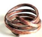
Anillo de cobre Bruno de I Bijoux Di Angel