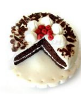
Broche bosque negro de Tampinha