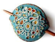
Pasador de pelo con ámbar de Criterio - Критерий