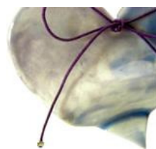
Collar corazón de Lemanilaterra