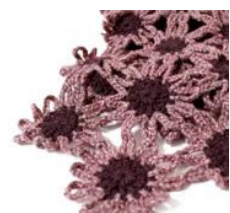
Bufanda multiflores de Tampinha