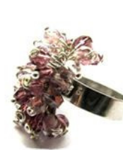
Anillo de Fimos&arames