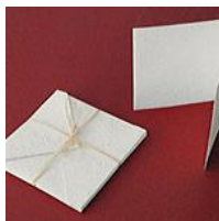
Sobres con tarjeta del taller Okille Tailerra