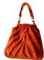
Bolso de Oltrelalana Accessori In Lana&