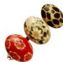
El rincón de Amatista