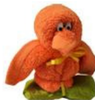
Pulcino de Origami