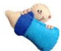
Broche Bautizo de Ainhoa Todoamano