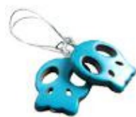
Pendientes de Hawlita de Sandstar Jewelry Designs