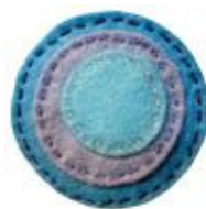
Broche de fieltro de Farbalans