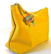
Riñoñera de piel de Solocoio

La pasión del encuentro de diferentes materiales, lleva al nacimiento de " Turquesa verdadera ". El cuero de gamuza marrón, cuidadosamente embutido a mano, le da vida y color a las pequeñas cuentas que, con mucho detalle, le fueron cocidas. En el centro de la pieza, con un protagonismo especial, está el cabujón turquesa. En un elegante juego de asimetría, de él salen las 3 cadenas de plata que le dan el acabado al exquisito collar de Creazioni By Mia .