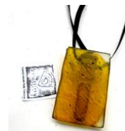
Dije Cosmopolis de Paola Frusteri