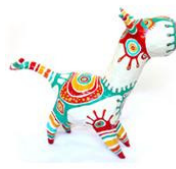
Figura de papel maché de Cartò