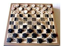
Juego de damas de Juegos Del Bufón