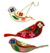
Perquitos de fieltro de La Bottega Di Sissi