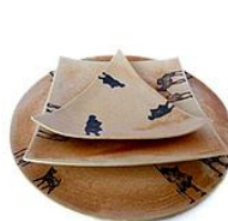
Platos de cerámica de Lastresmas1

Y en este concierto también hay olores, los de los tintes, las pinturas, barnices y nogalinas. En esta combinación de sonidos, olores y colores, los personajes musicales de Pontevedra cobran vida propia.